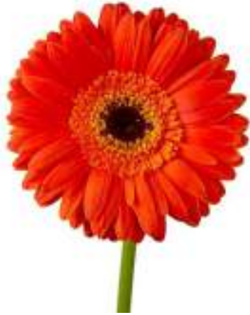
The Gerbera Daisy -The flower of Eritrea