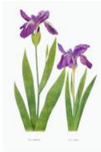
The Iris Tectorum - the flower of Algeria