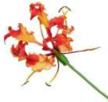
The Flame Lily - the flower of Zimbabwe