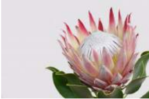
The Protea - the flower of South Africa