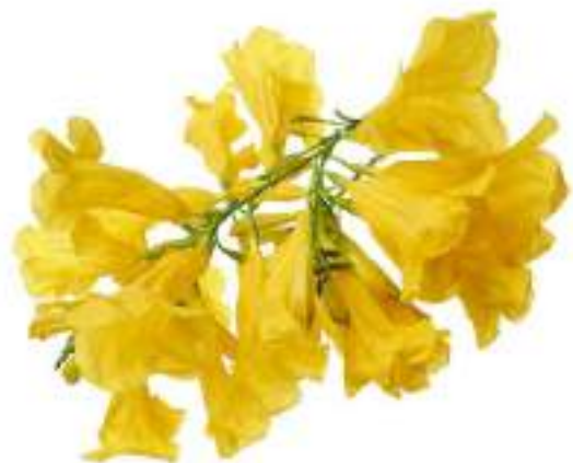
The Yellow Trumpet - The flower of Nigeria