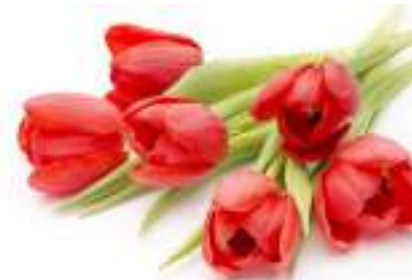
The Tulip - the flower of Afghanistan