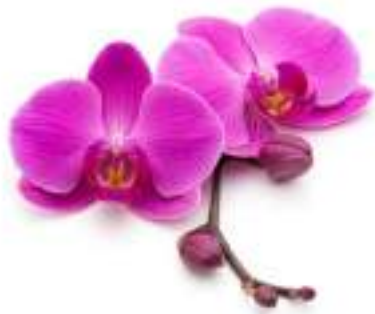
The Orchid - the flower of Kenya