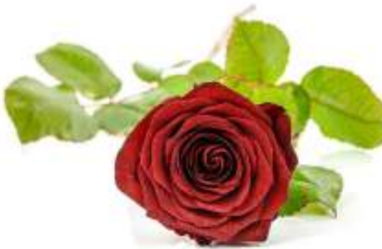
The Rose - the flower of Morocco