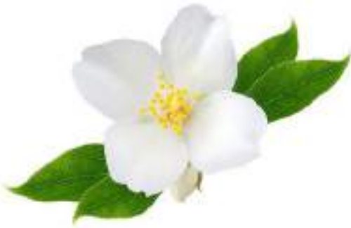
Jasmine - the flower of Pakistan