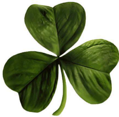
The Shamrock - the flower of Ireland