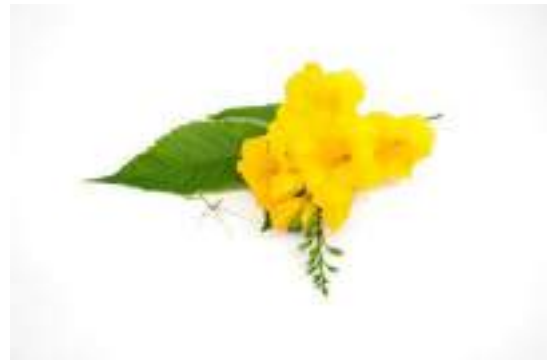
The Tecoma Chrysostricha - the flower of Brazil