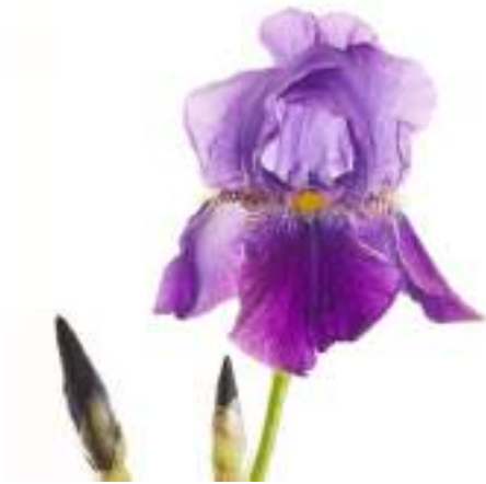
The Faqqua Iris - the flower of Palestine